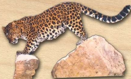
Puma aus Sperrholz

Inhalt: Im „Therapeutischen Werken“ arbeiten wir mit Holz. Dieses wunderbare Material bietet eine große Fülle an handwerklichen und gestalterischen Möglichkeiten. Sie können Laubsägearbeiten, Handschmeichler, schöne oder nützliche Sachen herstellen. Sie können auch einfache Musikinstrumente bauen, sich an Schnitzereien oder Intarsien wagen oder auch eigene Ideen umsetzen. Sie arbeiten in einer gut ausgestatteten Holzwerkstatt.