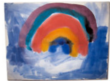
„Regenbogen“ - Aquarell von Kevin, 6 Jahre

E ine Ergotherapie stunde dauert (je nach Verordnung) 45-60 min und findet einmal wöchentlich statt. Termine vereinbaren wir telefonisch oder beim Vorgespräch; Sie erreichen mich am besten Morgens zwischen 8:00 und 9:00 und abends nach 19:15 unter der Nummer 0741-4800987. Die genauen Zeiten spreche ich jeweils auf den Anrufbeantworter!