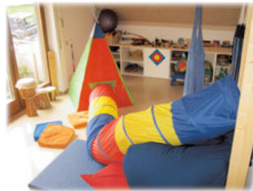
Abenteuerlandschaft im Spiel- und Bewegungsraum

„versäumte“ Erfahrungen nachzuholen und so durch eigene Aktivität die Defizite im Laufe der Zeit auszugleichen. In der SI-Therapie arbeite ich z.B. mit Hängematten, Rollbrett, Kletterparcours, Balanciergeräten, Sprossenwand, Sitzsäcken etc.