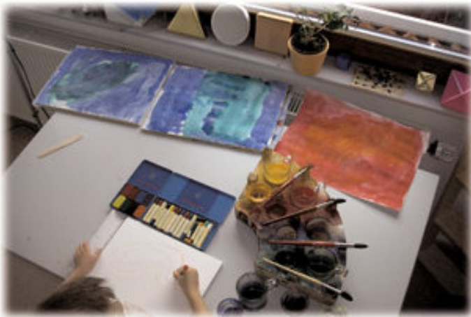
Am Mal- und Basteltisch...