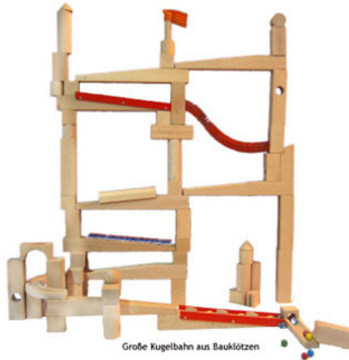
Große Kugelbahn aus Bauklötzen